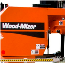
Cubiertas para las sierras con bisagras

Wood-Mizer Industries , fundada en 1982 en Indiana (EE.UU), diseña y fabrica aserraderos, sierras cintas, reaserraderos, desorilladoras, afiladores, líneas de procesos inteligentes, (entre otros productos) que aumentan la producción de aserrío en las empresas, ayudando a reducir los costes operativos aumentando el rendimiento de cada tronco. Con sus modernas instalaciones de fabricación en Estados Unidos y Europa garantizan la máxima calidad y el mejor servicio técnico de la industria en sus productos. Un estricto control de calidad y una mejora constante, son implementados para mejorar los procesos, calidad y velocidad en cada proceso de la fabricación, desde el desarrollo inicial, hasta el montaje final de cada proyecto.