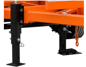
Conjunto de seis patas de apoyo ajustable

Para nivelar y estabilizar la bancada con precisión.