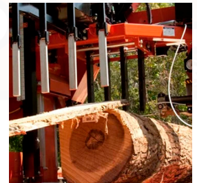
Brazo de retorno automático de tablas y mesa

Brazo de retorno automático de tablas y mesa ayudan a manejar las tablas. Incluye mesa de 91 cm x 1.5 m (3'x5').