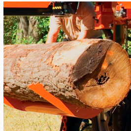
Brazo de carga hidráulico

Centralizado en un sólo pedestal remoto.