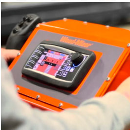
Interfaz intuitiva para el operador

Para nivelar y estabilizar la bancada con precisión.