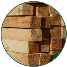
Facilidad para reaserrar tablas de múltiples espesores