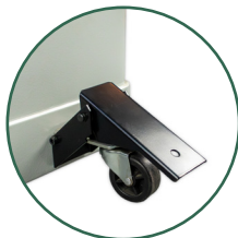
Pedal de elevación para fácil transporte.