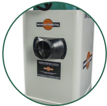
Gabinete cerrado para mayor seguridad.