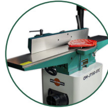
Mesa de hierro colado, estable y resistente.