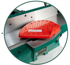
Guarda retráctil para proteger los dedos.