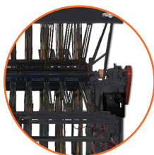
Estructura de acero reforzado.