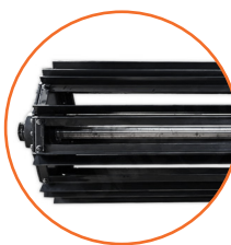
10 secciones giratorias.

Omega Machinery Inc es una marca registrada en varios países que agrupa a un consorcio de fábricas líderes en sus mercados a nivel mundial. Todos nuestros equipos son fabricados con la mayor tecnología disponible. Nuestros procesos de fundición cumplen con los más altos estándares de calidad. Cuerpos de trabajo diseñados para evitar la vibración que incluyen una gran cantidad de acero, lo que los hace lograr un desempeño completamente confiable garantizando una vida útil durante muchos años de trabajo. Todos los procesos de maquinado se realizan con equipos CNC. Sólo utilizamos componentes eléctricos y neumáticos de marcas líderes a nivel mundial, logrando con esto un fácil suministro de refacciones y minimizando tiempos.