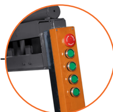
Control intuitivo para fácil operación.