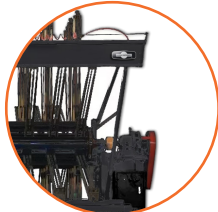
Sistema giratorio automático