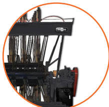
Seguridad integral del operador.