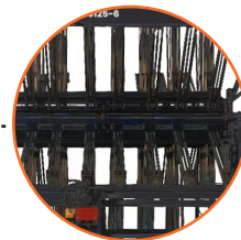
6 prensas hidráulicas por sección.