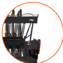
Seguridad integral del operador.