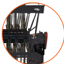
Sistema giratorio automático.