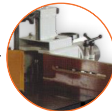
Boquillas para router incluidas.