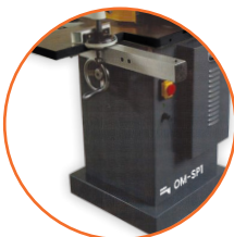
Construcción robusta anti-vibración.