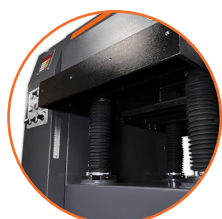
Mesa de hierro fundido montada en 4 columnas.