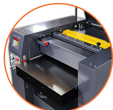
Ancho máximo de cepillado de 630 mm (25").

Omega Machinery Inc es una marca registrada en varios países que agrupa a un consorcio de fábricas líderes en sus mercados a nivel mundial. Todos nuestros equipos son fabricados con la mayor tecnología disponible. Nuestros procesos de fundición cumplen con los más altos estándares de calidad. Cuerpos de trabajo diseñados para evitar la vibración que incluyen una gran cantidad de acero, lo que los hace lograr un desempeño completamente confiable garantizando una vida útil durante muchos años de trabajo. Todos los procesos de maquinado se realizan con equipos CNC. Sólo utilizamos componentes eléctricos y neumáticos de marcas líderes a nivel mundial, logrando con esto un fácil suministro de refacciones y minimizando tiempos.