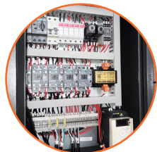
Panel eléctrico que integra protecciones, transformador y variador de frecuencia para el control y resguardo de los motores.