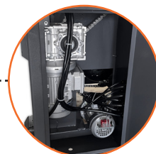
Motores potentes para corte, alimentación y elevación.