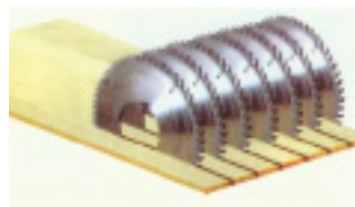
Sistema de corte posicionado en la parte inferior