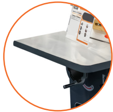
Mesa de trabajo resistente