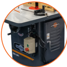
Construcción robusta anti-vibración