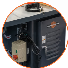
Doble velocidad de giro