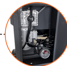
Motores potentes para corte, alimentación y elevación.