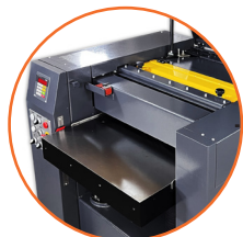
Ancho máximo de cepillado de 630 mm (25").

Omega Machinery Inc es una marca registrada en varios países que agrupa a un consorcio de fábricas líderes en sus mercados a nivel mundial. Todos nuestros equipos son fabricados con la mayor tecnología disponible. Nuestros procesos de fundición cumplen con los más altos estándares de calidad. Cuerpos de trabajo diseñados para evitar la vibración que incluyen una gran cantidad de acero, lo que los hace lograr un desempeño completamente confiable garantizando una vida útil durante muchos años de trabajo. Todos los procesos de maquinado se realizan con equipos CNC. Sólo utilizamos componentes eléctricos y neumáticos de marcas líderes a nivel mundial, logrando con esto un fácil suministro de refacciones y minimizando tiempos.