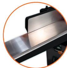
Mesa de hierro fundido, estable y resistente.