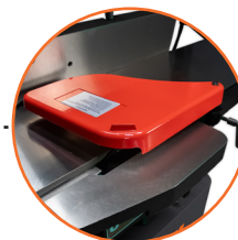
Guarda retráctil para proteger los dedos.