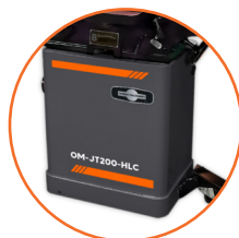
Gabinete cerrado para mayor seguridad.