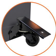
Pedal de elevación para fácil transporte.