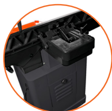
Guía escantillón ajustable de -45^{\circ} a 45^{\circ} .

Omega Machinery Inc es una marca registrada en varios países que agrupa a un consorcio de fábricas líderes en sus mercados a nivel mundial. Todos nuestros equipos son fabricados con la mayor tecnología disponible. Nuestros procesos de fundición cumplen con los más altos estándares de calidad. Cuerpos de trabajo diseñados para evitar la vibración que incluyen una gran cantidad de acero, lo que los hace lograr un desempeño completamente confiable garantizando una vida útil durante muchos años de trabajo. Todos los procesos de maquinado se realizan con equipos CNC. Sólo utilizamos componentes eléctricos y neumáticos de marcas líderes a nivel mundial, logrando con esto un fácil suministro de refacciones y minimizando tiempos.