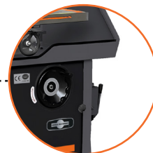
Bomba de aceite integrada.