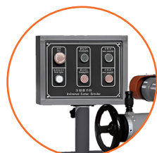
Panel de control frontal de fácil acceso.

Omega Machinery Inc es una marca registrada en varios países que agrupa a un consorcio de fábricas líderes en sus mercados a nivel mundial. Todos nuestros equipos son fabricados con la mayor tecnología disponible. Nuestros procesos de fundición cumplen con los más altos estándares de calidad. Cuerpos de trabajo diseñados para evitar la vibración que incluyen una gran cantidad de acero, lo que los hace lograr un desempeño completamente confiable garantizando una vida útil durante muchos años de trabajo. Todos los procesos de maquinado se realizan con equipos CNC. Sólo utilizamos componentes eléctricos y neumáticos de marcas líderes a nivel mundial, logrando con esto un fácil suministro de refacciones y minimizando tiempos.