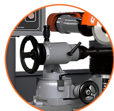
Rango de disco de 105 mm a 500 mm.