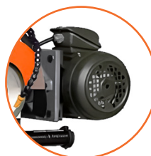
Motor monofásico 220V de 3/4 HP.