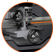
Diámetro máximo de las fresas de 400 mm.