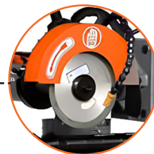
Rueda de afilado de alta velocidad \pm 45^\circ .